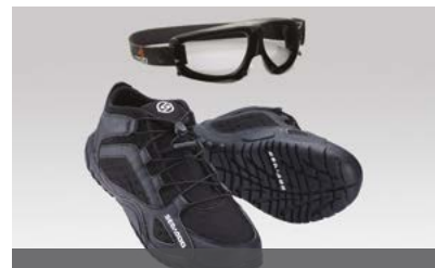
Спеціальні черевики та захисні окуляри Sea-Doo ® для їзди (за додатковим замовленням)